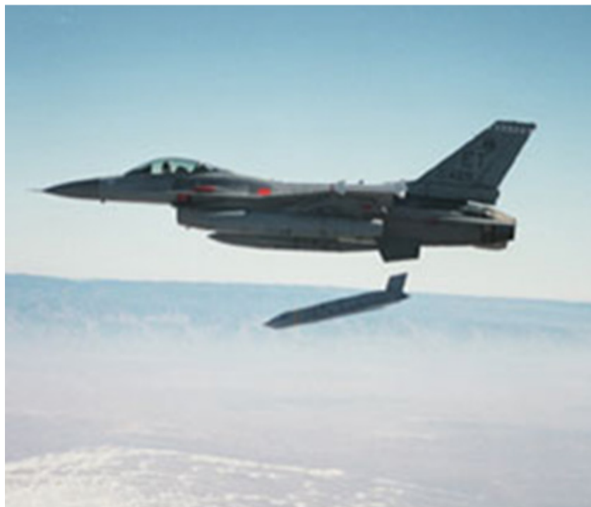
Figura 2 - Cça F-16 largando uma munição guiada por GPS.