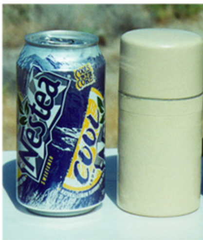
Figura 5 - Imagem de um empastelador de GPS de 1 W (Como comparação, apresenta-se ao lado do empastelador uma lata de Nestea ).