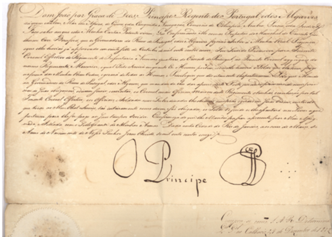
Fig 2 – Carta Patente de promoção do Tenente-Coronel agregado Havilland Le Mesurier a Tenente-Coronel do Regimento de Infantaria nº 14, assinada no Rio de Janeiro, por S.A.R. o Príncipe Regente, futuro D. João VI

Entre os documentos dos processos individuais destacam-se as “ cartas patentes ”, de promoção, assinadas pelo Príncipe Regente (figura 2), as fichas de avaliação semestrais (figura 3) e alguma correspondência oficial.